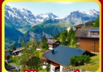
หมู่บ้านเมอร์สเรน