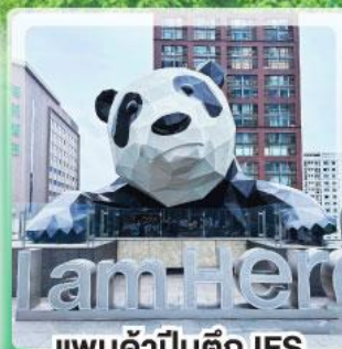
แพนด้าป็นตึก IFS