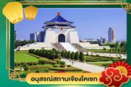
อนุสรณ์สถานเจียงไคเชก