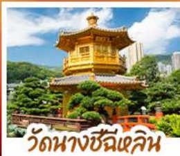
วัดนางชีฉีเสียน