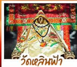
วัดเสียนฟ้า