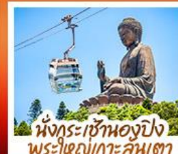
นั่งกระเช้าแองปิง พระใหญ่เกาะคิมตา