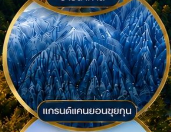
แกรนด์แคนยอนซุยกุณ