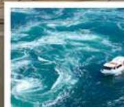
คลองเรือชมน้ำวนมารุโตะ

คลองเรือชมน้ำวนมารุโตะ / ซุปบึงย่านชินโซบาชิ / ตลาดปลาคุโรมง / ซุปบึงย่านอุมาเดะ