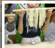
กิจกรรมทำเส้นอุด้ง