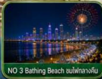
NO 3 Bathing Beach ชมไฟกลางคืน