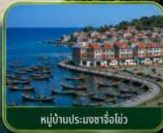
หมู่บ้านประมงซาจื่อไ่