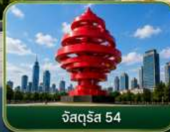
จัลสุริยา 54