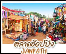
ตลาดช้อปปิ้ง JANPATH