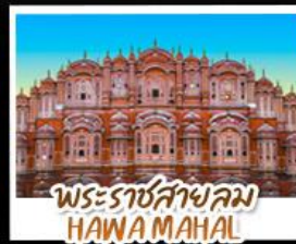
พระราชสาลม HAWA MAHAL