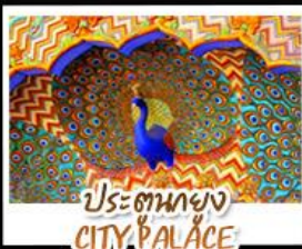
ประตูของ CITY PALACE