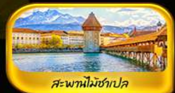
สะพานไมซ์าเปลา