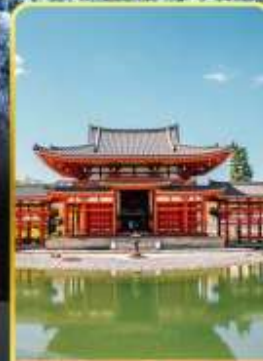
วัดเมียวโด้อิน