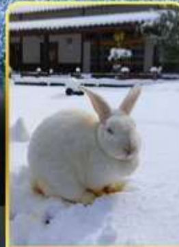
หมู่บ้านกระด่ายคางะ