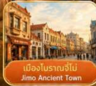
เมืองโบราณจื่อไ้ Jimo Ancient Town