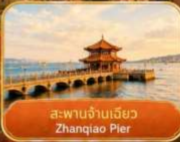
สะพานจันเจียว Zhanqiao Pier