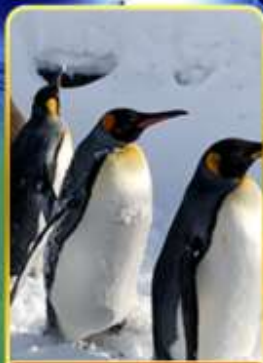
พาเหรดกเพนกวิน