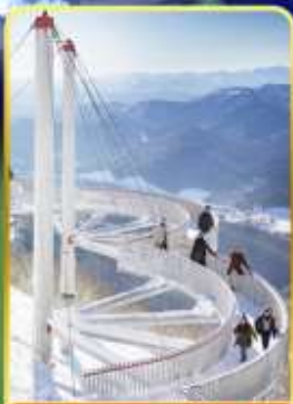
ระเบียงหมอกน้ำแข็ง