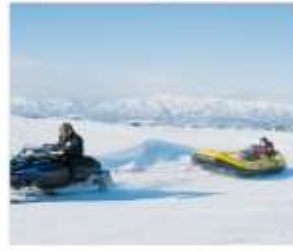
กิจกรรมบีโบสโนว์แลนด์