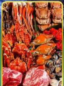
ปิ้งย่างพรีเมียมมันตะ