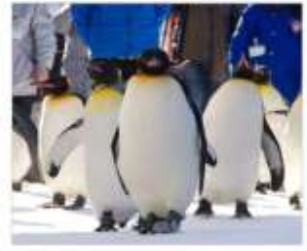
ชมพาเหรดแพนกวิน