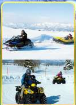
BIBAI SNOW LAND