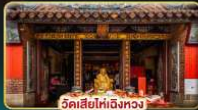
วัดเสี่ยไท่อิงทวง