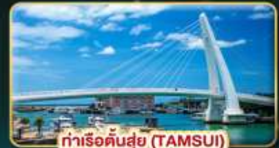
ท่าเรือตันสุ่ย (TAMSUI)