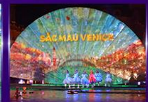
Sac Mau Venice Show