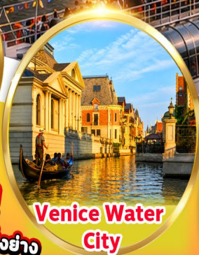
Venice Water City