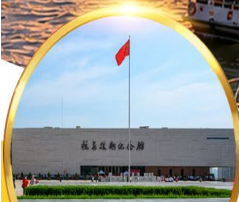
พิพิธภัณฑ์สงคราม เกาหลีตานตง