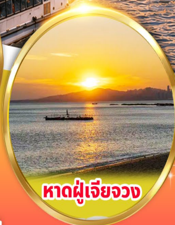
หาดผู้เจียวจง