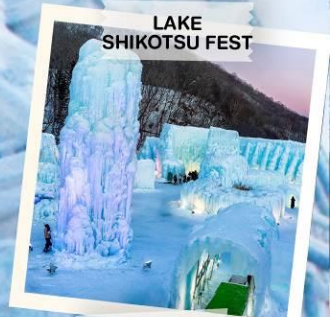
LAKE SHIKOTSU FEST