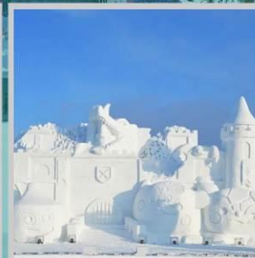
“ASAHIKAWA SNOW FEST”