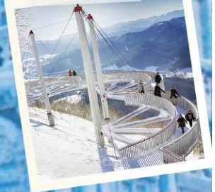
UNKAI TERRACE “CLOUD WALK”