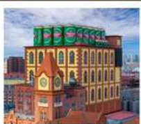
โรงเบียร์สิงเต่า