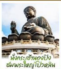
นั่งกระเช้ามองปิง ชมพระใหญ่ไผ่หลิน

นั่งกระเช้ามองปิงสักการะพระใหญ่ไผ่หลิน • วัดหวังต้าเซียน ขอพรสุขภาพ ความรัก วัดเขกงหมิว ขอพรองค์แชง โชคลาภ การเงิน และธุรกิจ • เทพเจ้ากวนไท ความซื่อสัตย์ เงินทอง ธุรกิจมั่นคง • เจ้าแม่กวนอิมรีพลัสฮัมป์ รับพลังงานดี เสริมพลังฮวงจุ้ยที่รีพลัสฮัมป์