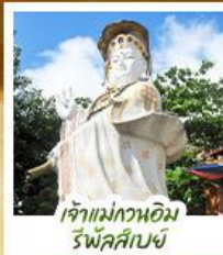
เจ้าแม่กวนอิม รีพลัสฮัมป์