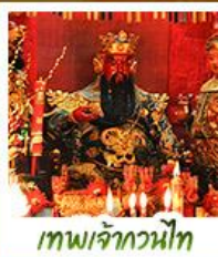
เทพเจ้ากวนไท