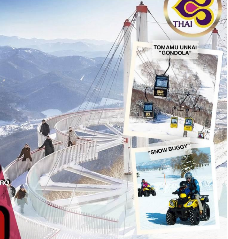
TOMAMU UNKAI "GONDOLA"