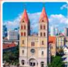
โบสถ์ซันตโมเชิล