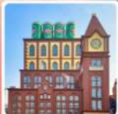
พิพิธภัณฑสถาน