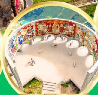
Russian-Georgian Friendship Monument