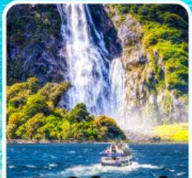
บิลฟอร์ด ซาวด์ นั่งเรือชมความงาม ฟยอร์ด