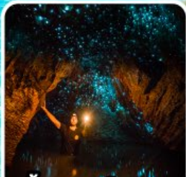
ถ้ำทอนเรืองแสง ไวโตโม