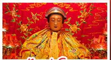
วัดเล่งจื๊อ