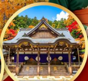
ศาลเจ้าฮิสะ