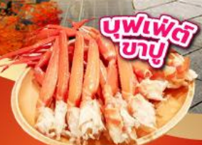
บุฟเฟ่ต์ ซาซู