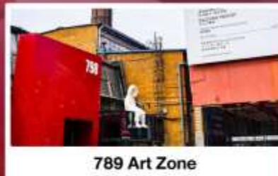
789 Art Zone