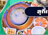
ชาบู แซลม่อน