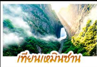
เทียนเหมินชาน

การันตีเที่ยวเต็มอิ่มแบบไม่ลงร้าน • รวม 5 เมืองโบราณชื่อดังไว้ในทริปเดียว ขึ้นเขาอวดคาร์คัวลิลฟ์แก้วไปหลง • นั่งกระเช้าพิชิตทิวประตูลงสวรรค์ที่ขุนเขา เดินท้าความเสียวบนหน้าผากระຈກ • ล่องเรือชมภาพเขียนบนน้ำอุ๊ยเจียง