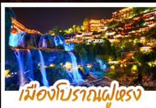
เมืองโบราณฝูเจียง