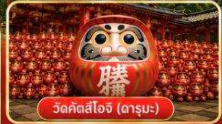
วัดคิตสึโอจิ (ดาร์มะ)