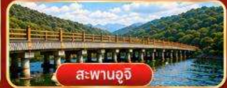
สะพานอูจิ