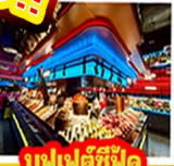
บูฟเฟต์ชิฟู้ด