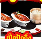
เปิดปิ้งกั๊ง