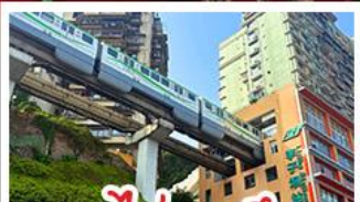
รถไฟทะลุคด