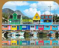
ท่าเรือจ้งนึม