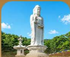
วัดดงชวาซา

เปิดประสบการณ์เที่ยวเกาหลีสุดคุ้ม บินครั้งเดียว เที่ยวสองเมือง • เช็กอินถนนนักร้องคิมควังซอก สัมผัสเสน่ห์ศิลปะและเสียงเพลง • นั่งรถไฟปิ๊กชมวิวทะเลปูซาบ • หมู่บ้านคิมซอนสีสดใสใ ก่อนเยือนวัดแฮดงยงกุงซาและวัดคยองฮวาซา เสริมความเป็นสิริมงคล • เวชสำอางร้าน Bunezia ปิดท้ายด้วยช้อปปิ้งเอาท์เล็ทแดนคัมมาร์เก็ตซ็อง พร้อมเดินช้อปปิ้ง Walking Street สุดฟิว