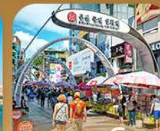
ตลาดนัมโพดง