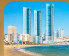
หาดแซอินแด