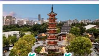
วัดเลงเซ้ง