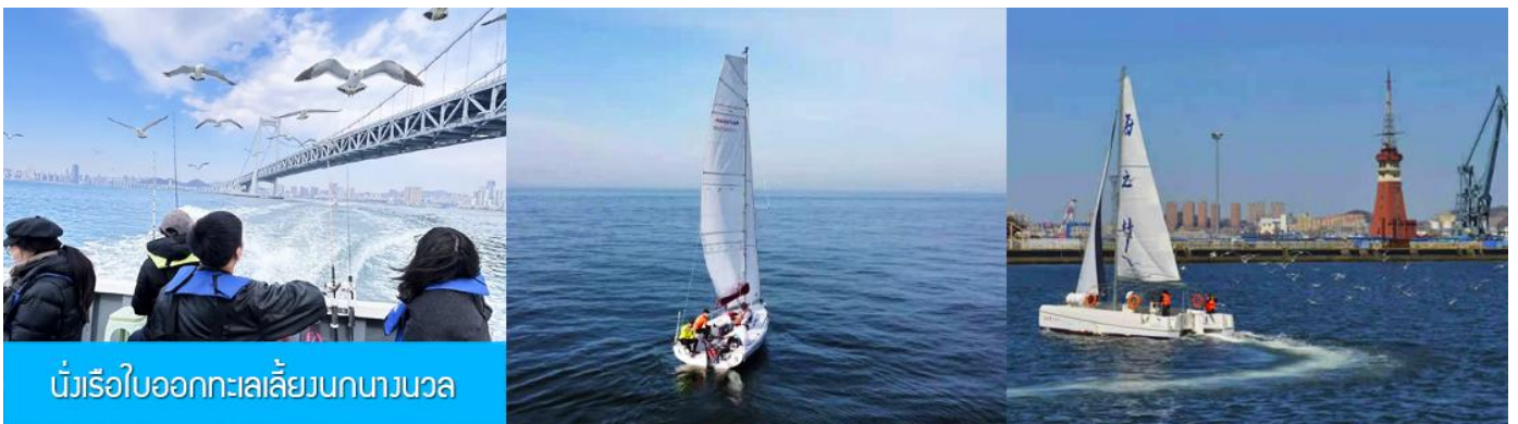
นั่งเรือใบออกทะเลลิ้นกนางนวล