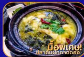
มีอพิเศษ! ปลาต้มผักกาดดอง