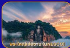
พระใหญ่เล่อซาน (UNESCO)

ล่องเรือชม "พระใหญ่เล่อซาน" - เมืองโบราณหวงหลงซี - แพนด้าเซลฟี - ห้องสมุดจงซูเก่อ - Wangjianglou Park - ถนนชุนซีลู่ (แหล่งช้อปปิ้ง) - IFS (แพนด้าปิ่นตึก) - วัดต้าจื่อ