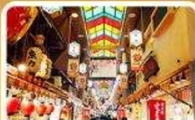
ตลาดปลาชิชิ