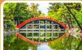
ศาลเจ้าสุมิโยชิ โกเบ