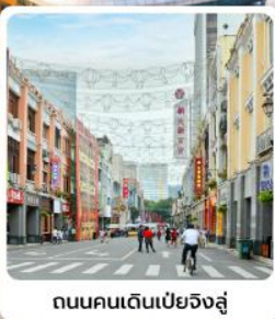
ถนนคนเดินเป่ย์จิงลู่