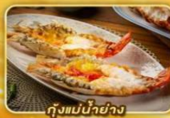
กุ้งแม่น้ำย่าง