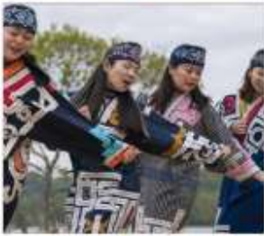
ฟิฟิรกันท์ไอนุ UPOPOY