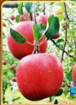
เก็บแอปเปิล