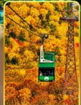
กระเช้าโรดามากะ