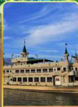
ล่องเรือทะเลสาบโทโยะ