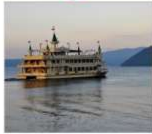
ล่องเรือทะเลสาบไทยะ