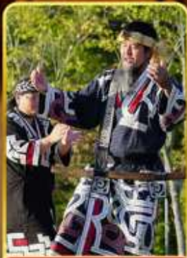
พิพิธภัณฑ์โอนู