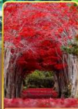
สวนฮิราโอกะ