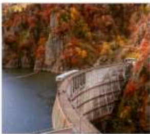
เขื่อนโซเซเดียว