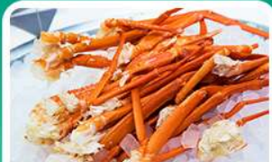
พิเศษ! บุฟเฟ่ต์ขาปู