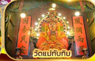
วัดแม่ทับทิม