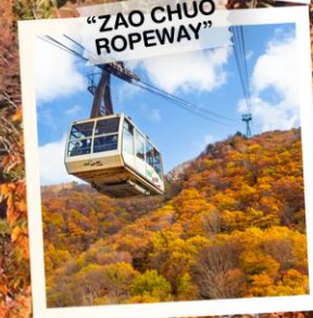
"ZAO CHUO ROPEWAY"