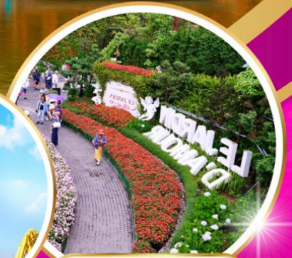
Le Jardin d'Amour