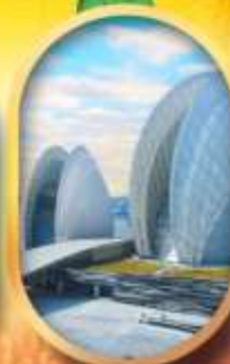
โรงละครไข่มุก