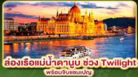
ส่องเรือแม่น้ำดานูบ ช่วง Twilight พร้อมจินตนาการ

📅 เดินทาง: 02-09 ธ.ค. | 06-13 ธ.ค. 10-16 ธ.ค. 69