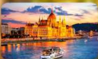
ส่องเรือแม่น้ำดานูบ ช่วง Twilight พร้อมจิบแชมเปญ