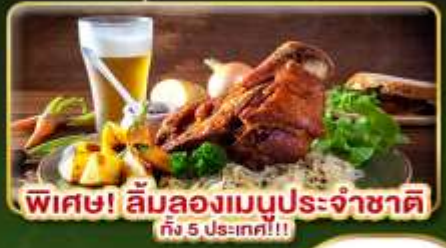
พิเศษ! ลิ้มลองเมนูประจำชาติ ถึง 5 ประเทศ!!!