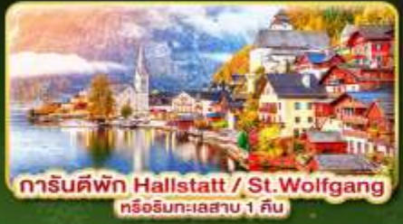
ทารินต์พัก Hallstatt / St. Wolfgang หรือริททะเลสาบ 1 คืน