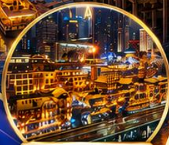
หงหยาดิ่ง