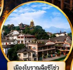
เมืองโบราณเฉิงชิว