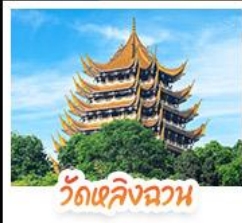
วัดเลิ่งฉวน