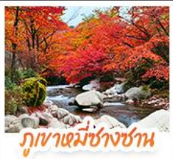
ภูเขาหมี่ซางชาน