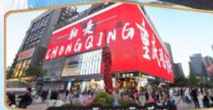
ถนนคนเดินทงยวนเฉียว