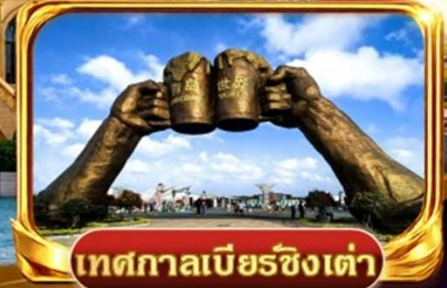
เทศกาลเบียร์ชิงเต่า