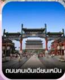
ถนนคนเดินเฉียนเหมิน

✈️ คอนเฟิร์มออกเดินทาง ทุกพีเรียด 2 ท่านขึ้นไป